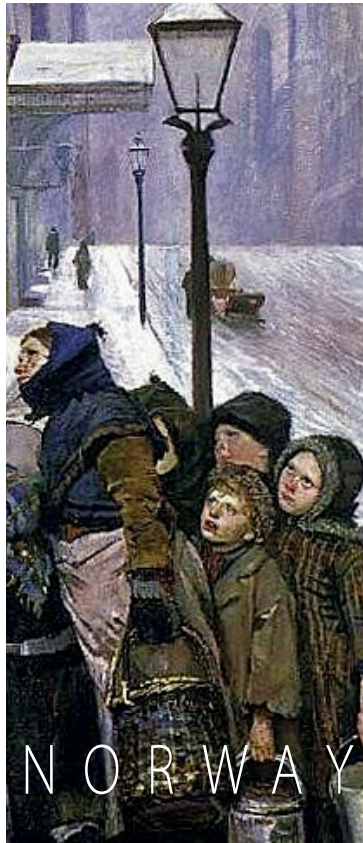
크리스티안 크로그 • 28 CHRISTIAN KROHG 1852~1925